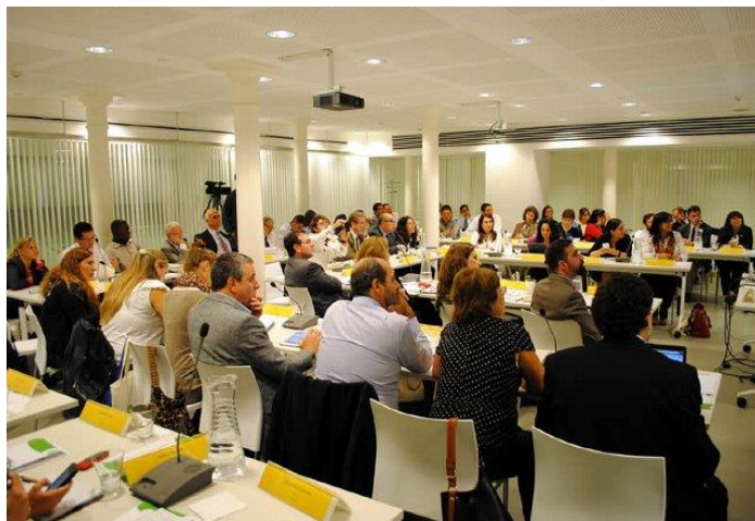
Imagen de la primera jornada del Taller, al que asistieron 50 representantes de operadores e instituciones del sector del agua y del saneamiento de 14 países de Latinoamérica, el Caribe y España.

Uno de los objetivos del Taller fue identificar posibles hermanamientos entre operadores de la región en la temática de Responsabilidad Social Empresaria, que serán apoyados por WOP-LAC. Para ello, se abrió una convocatoria a aquellos operadores interesados que finaliza el viernes 25 de abril de 2014.